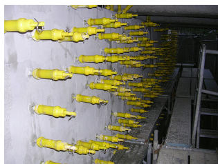
リハビリシリンダー設置状況