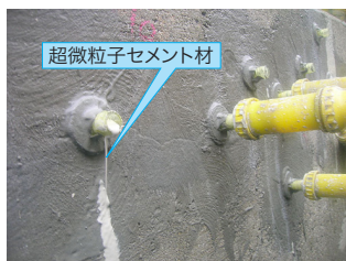
超微粒子セメント系注入材本注入の状況