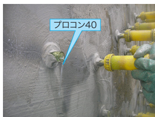
プロコン40先行注入の状況